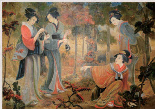
古田土雅堂《茸狩 (Take Gari)》1917年