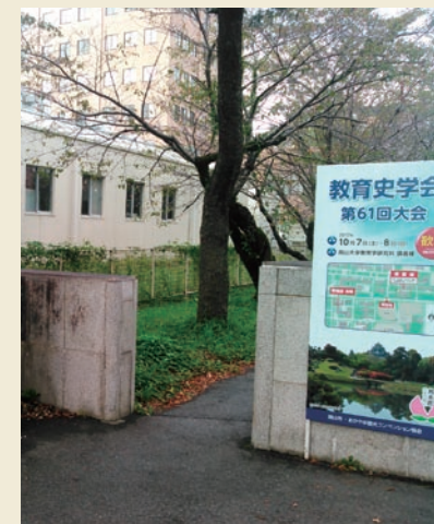
2017年度の大会会場(岡山大学)