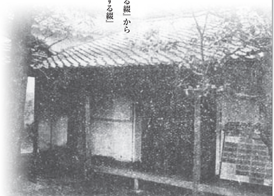
第九十例 附圖（第十四號）

一九六二年、静岡県に生まれる。 一九八四年、東京大学理学部生物学科卒業、一九八八年、東京大学大学院医学系研究科博士課程中退 現在は愛知県立大学教育福祉学部教授 主な著書『時代がつくる狂気——精神医療と社会』朝日新聞社、二〇〇七年（共著） 『治療の場所と精神医療史』日本評論社、二〇一〇年（編著）